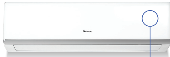
Unité murale LOMO 18