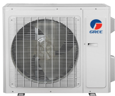
Condenseur LOMO 18