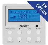
Thermostat filaire (XK-41)